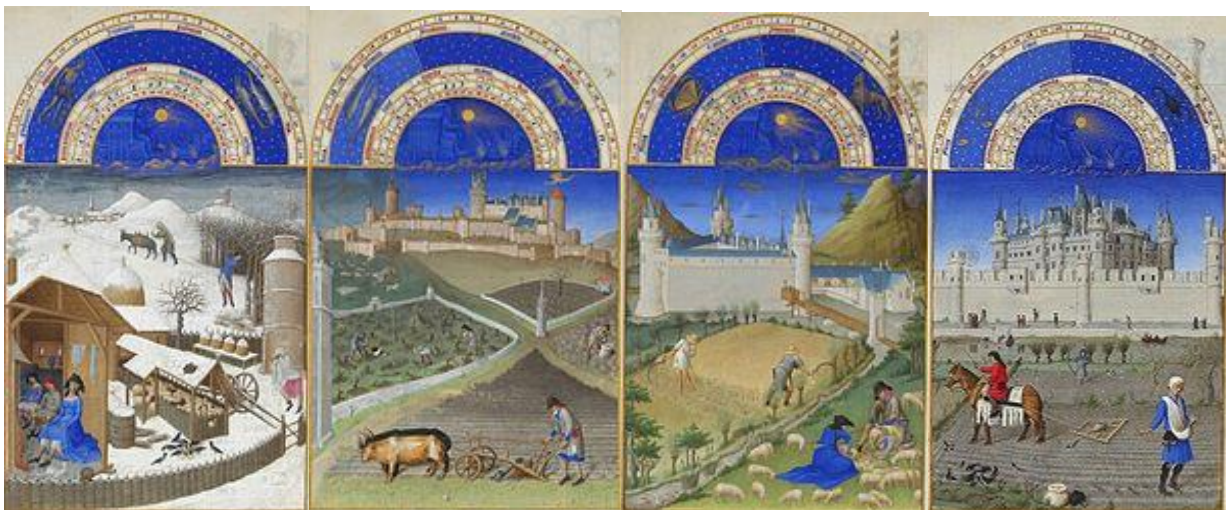
Брати Лімбурги. Сільськогосподарські роботи (лютий, березень, липень, жовтень)

2. Як на мініатюрах із середньовічного календаря — «Розкішного часослову герцога Беррійського» (XV ст.) — зображено взаємодію людини та природи?