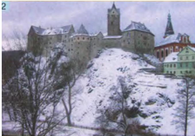
1. Родина біля каміну. Мініатюра XIVст. 2. Середньовічний пейзаж сучасної Чехії

2. Як на мініатюрах із середньовічного календаря — «Розкішного часослову герцога Беррійського» (XV ст.) — зображено взаємодію людини та природи?