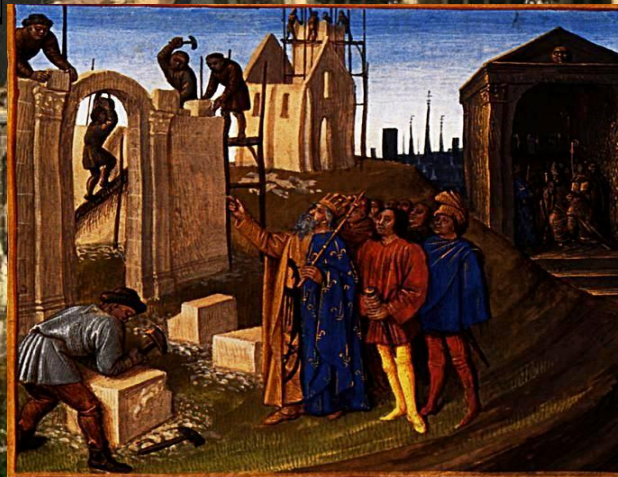
Карл Великий Будівельник. Мініатюра