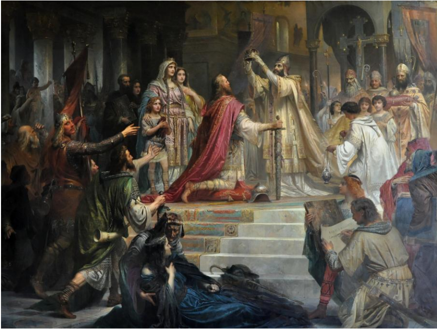
Фрідріх Каульбах. Імператорська коронація Карла Великого. 1861 р.

2. Опишіть, як відбувалася процедура коронування. Які деталі вам здаються важливими? Чому?