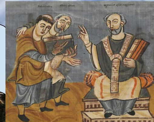
Учений Алкуїн (в центрі)

Робота при дворі Карла багатьох вчених з усієї Європи