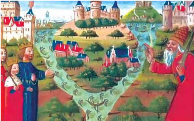
Розподіл Франкської імперії. Середньовічна мініатюра

2. Як ілюстрація відображає розкол Франкської імперії?